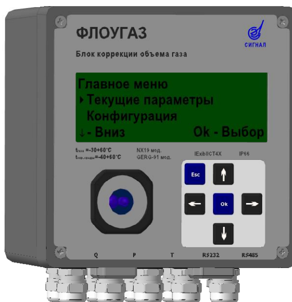
Рисунок 1 - Общий вид блока коррекции объема газа «ФЛОУГАЗ»