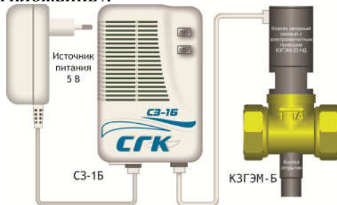
Рис. А1. Система СГК-1-х-Б с клапаном типа КЗГЭМ-Б.

1 – кабель типа UTP 2p Cat 5e, длина не более 10 м