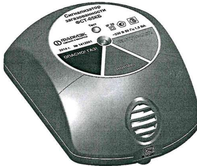
Рисунок 1. Внешний вид

Схема пломбировки для защиты от несанкционированного доступа и место для нанесения знака поверки в виде поверительного клейма-наклейки приведена в приложении А.