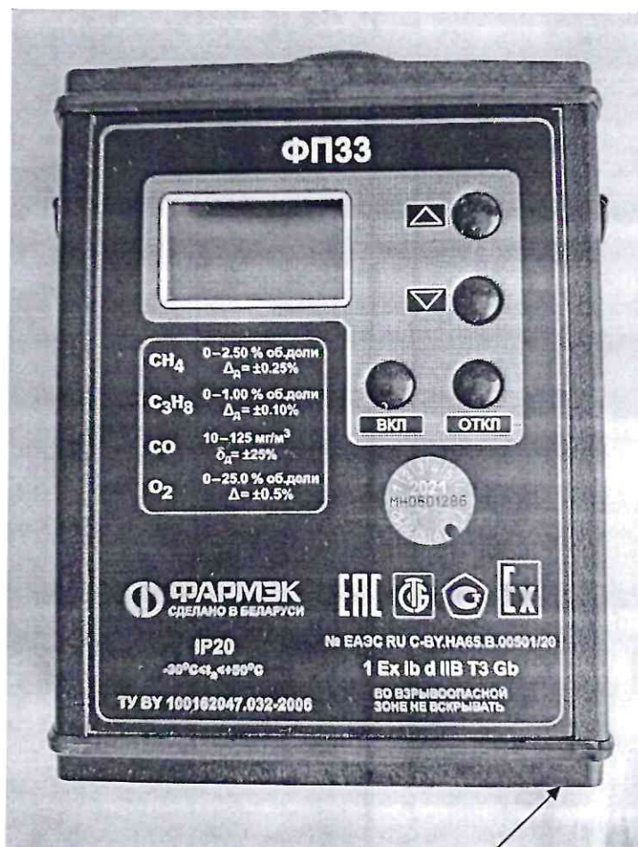
Схема пломбировки от несанкционированного доступа