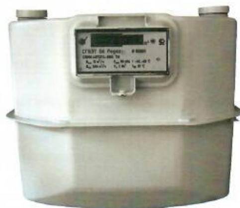
Рисунок 1 – Общий вид счетчиков газа бытовых с электронным термокомпенсатором СГБЭТ G6 «Pegas»

Конструкция счётчиков предусматривает возможность ремонта всех узлов в специальных организациях или на предприятии-изготовителе.